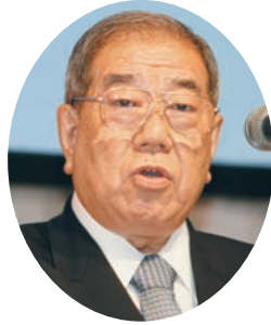
祝辞：渥美日本水道工業 団体連合会副会長