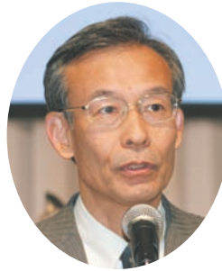
工務常設調査委員長報告： 高橋横浜市水道局担当理事