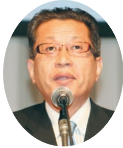
祝辞： 星原堺市議会議長