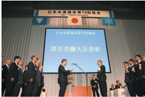
厚生労働大臣表彰