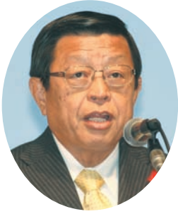
歓迎挨拶： 竹山堺市長