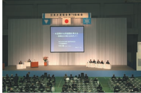
シンポジウム：公民連携の新たな展開 ―民間活力の導入―

ついて」、問題8「ダム建設に関する事業費の圧縮等について」、問題9「水利権許可の権限委譲及び水利権許可における条件緩和の推進について」が一括上程され、討議の結果、関係当局に陳情することと決定した。