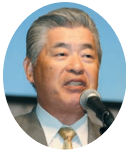
次期総会開催地挨拶： 渡邊松山市公営企業 管理者