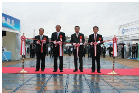
日本水道工業団体連合会水道展