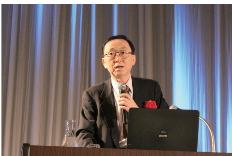
講師：余湖北海学園大学工学部教授