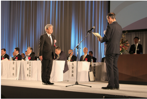
日本水道協会会長表彰（勤続賞）