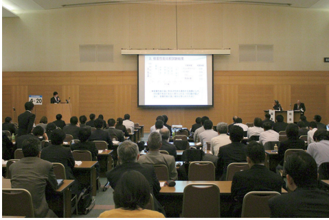
水道研究発表の様子