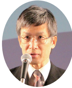
厚生労働大臣祝辞： 宮崎厚生労働省健康局 水道課長