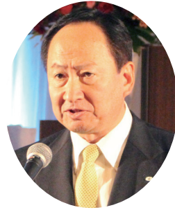
次期全国会議開催地挨拶： 日野さいたま市水道事業管理者