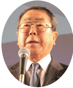
祝辞：木股日本水道 工業団体連合会会長