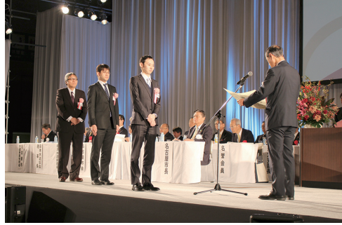
日本水道協会会長表彰（有効賞）