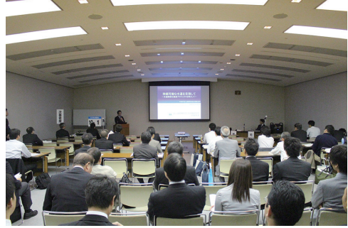
水道耐震化プロジェクト基調講演