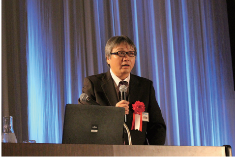
講師：秋葉国立保健医療科学院統括研究官