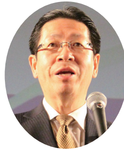
祝辞：三輪名古屋市会 副議長