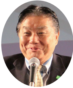
歡迎挨拶： 河村名古屋市長