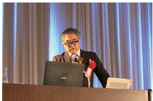
講師：柳原内閣官房情報セキュリティセンター 重要インフラグループ参事官