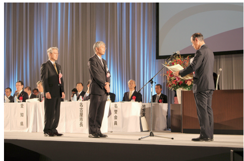
日本水道協会会長表彰（功労賞）