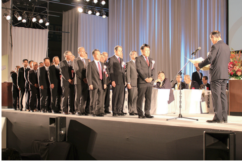
日本水道協会会長表彰（特別賞）