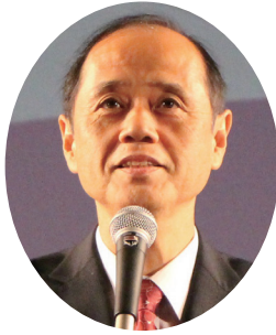
本協会代表挨拶： 大森副会長（岡山市長）