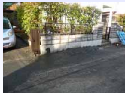
とりあえず家の前に泥を積み上げる