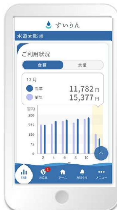
料金・水量履歴閲覧画面