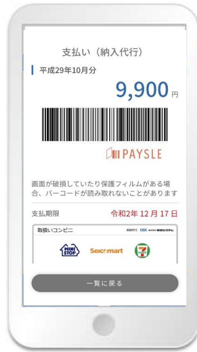
ペイسل支払画面 (コンビニバーコード)