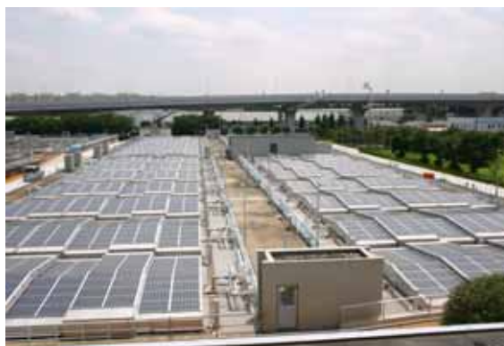
太陽光発電導入事例（ろ過池覆蓋）

発行 平成21年3月 定価 4,000円（税込） 会員価格 3,200円（税込）