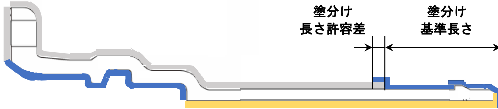
図 GX形異形管挿口 塗分け長さ