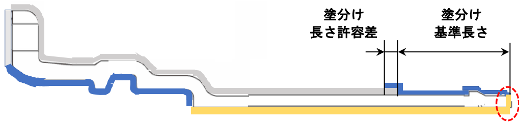
図 GX形異形管挿口 塗分け長さ