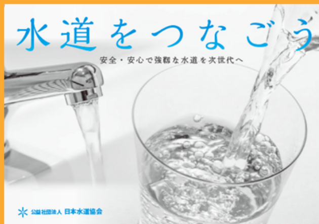
「伝わる」ことを重視して作成したデザイン